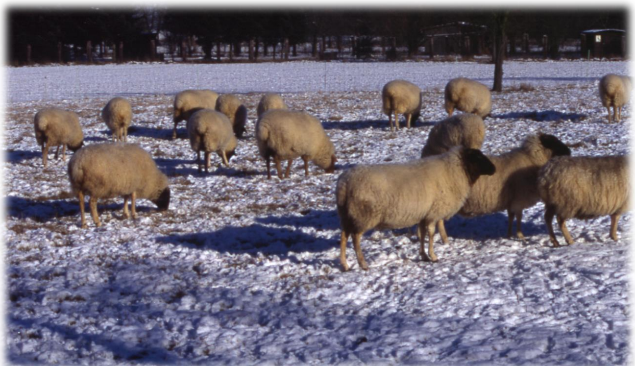
Schafe können mit ihrer dicken Wolle selbst tiefsten Temperaturen trotzen

Weidetiere haben eine deutlich tiefere Behaglichkeitstemperatur als der Mensch. Zudem entwickeln z. B. Pferde und Rinder, die das ganze Jahr über im Freiland gehalten werden, ein wesentlich dichteres Fell als Tiere, die das ganze Jahr über ihr Dasein im Stall fristen müssen (SAMBRAUS 2001). Ganz zu schweigen von den Schafen, die mit ihrer dicken Wolle selbst tiefsten Temperaturen trotzen können (ESSER 2002). Lediglich Ziegen sollten im Winter in den Stall, da sie wesentlich empfindlicher gegen Witterungsextreme sind, als die übrigen Weidetiere (SPANNL-FLOR & SAMBRAUS 2003). Ausnahmen bilden selbstverständlich kranke Tiere und Jungtiere, die noch nicht robust genug sind. Insbesondere Neugeborene, die noch nicht trocken sind, können bei Minustemperaturen leicht erfrieren.