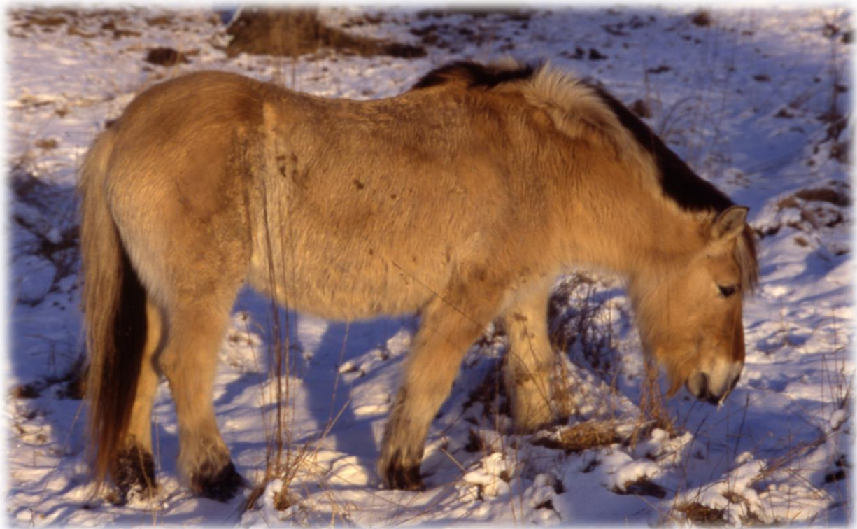
Robustpferde, wie der Norweger, entwickeln im Winter ein dichtes Fell