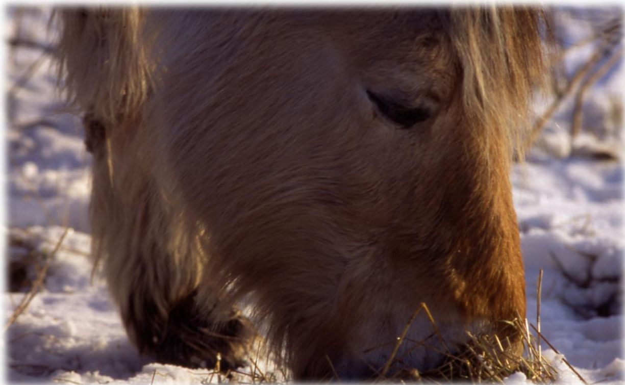
Auch bei geringen Schneelagen finden Weidetiere noch Futter; trotzdem sollte man jetzt zufüttern