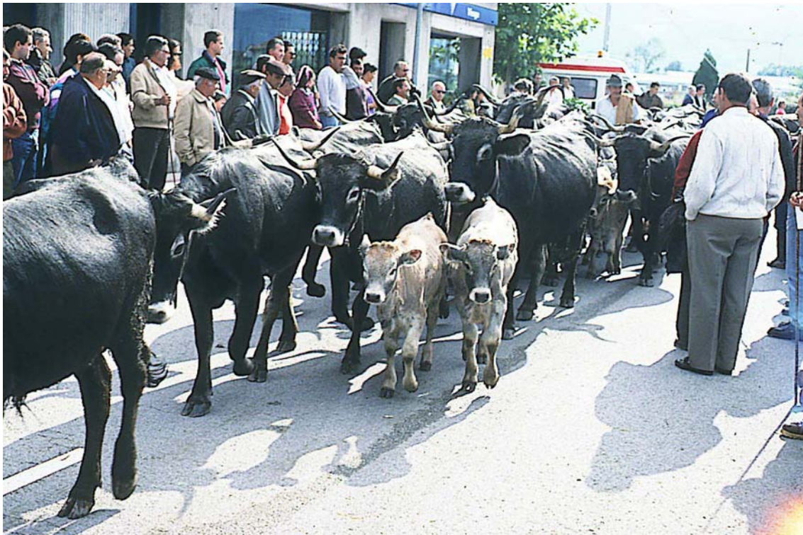
Auch Rinder werden durch Dörfer und Städte getrieben

Durch die Bemühungen von Jesus Garzon zog 1993 wieder die erste Herde mit etwa 2.000 Schafen und vier Hirten auf den alten Wanderwegen nach Norden, ein Jahr später waren es bereits zwei, danach drei und bald, so hofft Garzon, werden die Hirten wieder ihre Herden auf allen zehn Hauptrouten der Transhumanz durch Spanien treiben. Eine wichtige Weiche dazu wurde Anfang 1995 vom spanischen Parlament gestellt, als das alte Wegerecht in ein modernes Gesetz über die Vieh-Triften umgewandelt wurde. Dieses Gesetz schützt nicht nur die alten Canadas, es verpflichtet die Behörden auch, neue Triften bereitzustellen, wenn wieder mehr Hirten ziehen möchten.