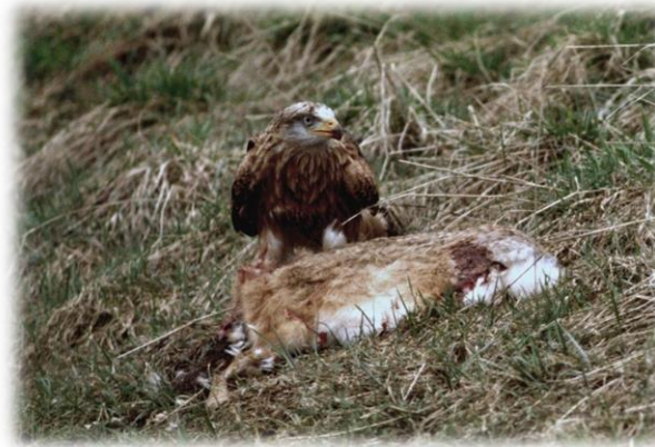
Rotmilan an Aas (R. Diemer)

Als Aasfresser und Kleintierjäger kontrolliert der Rotmilan im niedrigen Suchflug stundenlang die offene Landschaft mit kurzrasigen (beweideten) Flächen. Im Frühjahr besteht ein wesentlicher Anteil seiner Nahrung aus Regenwürmern, die zu Fuß erbeutet werden.