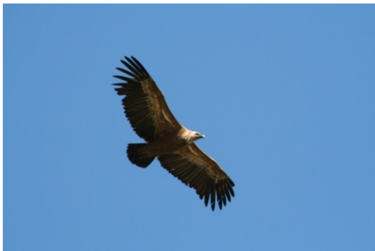
Auch Gänsegeier leiden unter der Schließung von Mülldeponien

Leider wurden durch die EU-Hygieneverordnung der letzten Jahre insbesondere in Südeuropa viele Schindanger, auf denen Aas gesammelt wurden, geschlossen, ebenso wie europaweit die kleinen Hausmülldeponien mit organischen Abfällen. Nicht nur Rotmilane, sondern auch andere Arten, wie z. B. Gänsegeier, wurden dadurch stark benachteiligt.