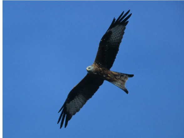
Typisch ist der gegabelte Schwanz

Als Aasfresser und Kleintierjäger kontrolliert der Rotmilan im niedrigen Suchflug stundenlang die offene Landschaft mit kurzrasigen (beweideten) Flächen. Im Frühjahr besteht ein wesentlicher Anteil seiner Nahrung aus Regenwürmern, die zu Fuß erbeutet werden.