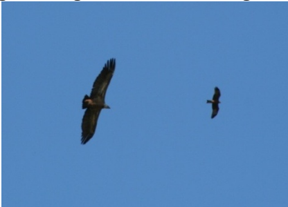
Geier und Milan auf der Suche nach Aas

In Deutschland allein brüten 10.000 bis 14.000 Paare, also über 50% des Weltbestandes. Deutschland hat deshalb für die Erhaltung der Art eine globale Verantwortung. In Spanien (Überwinterungsgebiet) wurde eine gefährliche Dezimierung der Spezies registriert (in 10 Jahren von 60.000 auf 35.000 Exp.). Ursachen hierfür liegen in den Pestiziden der Landwirtschaft, dem Gift für Raubtierfallen, einem Verschwinden der Schindanger sowie der illegalen Jagd während des Vogelzuges.