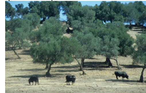
In der Extremadura werden Horstbäume zum Schutz des Rotmilans vom jährlichen Baumschnitt ausgespart.

In den spanischen Überwinterungsgebieten bewohnt der Rotmilan bevorzugt die offenen Agrarlandschaften von Kastilien und die Dehesas der Extremadura wo auch die spanische Population brütet.