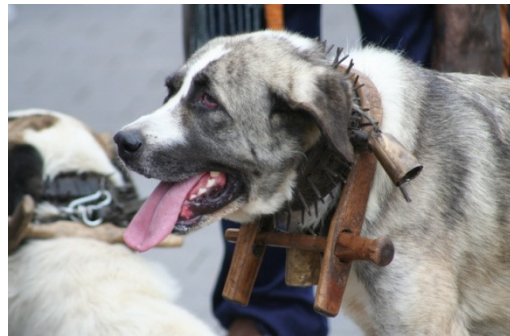
Zum Schutz gegen Wölfe trägt dieser spanische Mastino ein Stachelhalsband