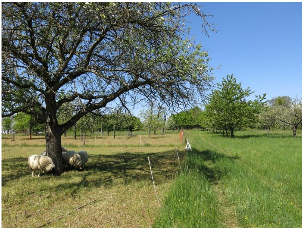
Abbildung 9: Die auf dem Dorheimer Wingert vorkommenden Brutvogelarten Gartenrotschwanz, Wendehals, Steinkauz und Grünspecht profitieren von einem Mosaik aus abgeweideten Flächen, erst spät genutzter Vegetation, Hecken und Erd-Gras-Wegen.