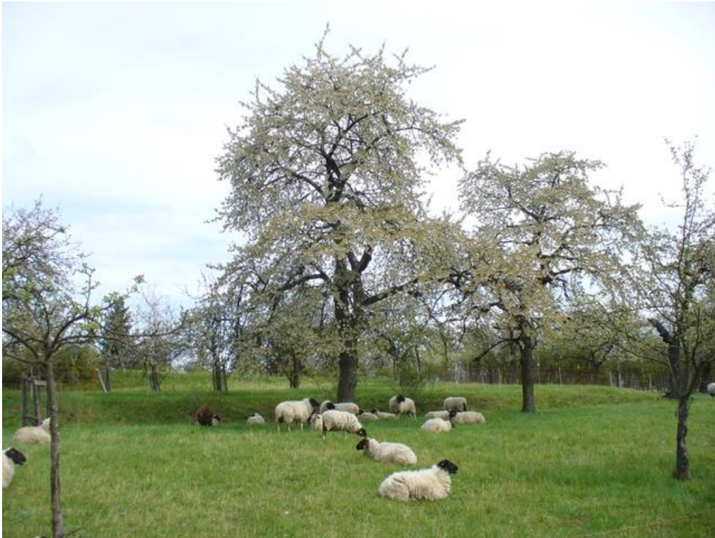
Abbildung 6: Eine Herde Rhönschafe bei der Arbeit im Frühjahr während der Kirschblüte. In der Bildmitte sind ehemalige Acker- oder Weinterrassen zu erkennen.