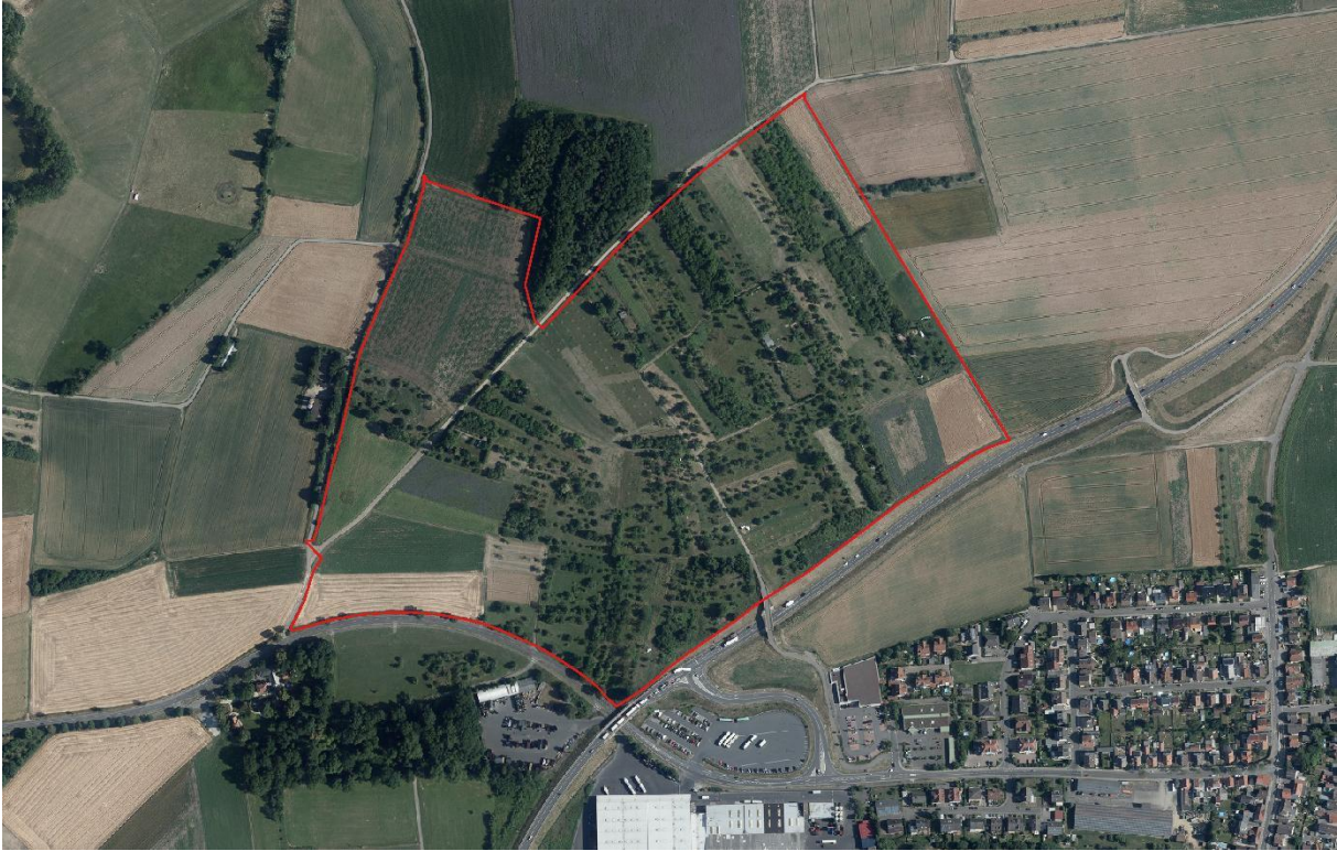
Abbildung 1: Gebietsgrenze „Wingert bei Dorheim“