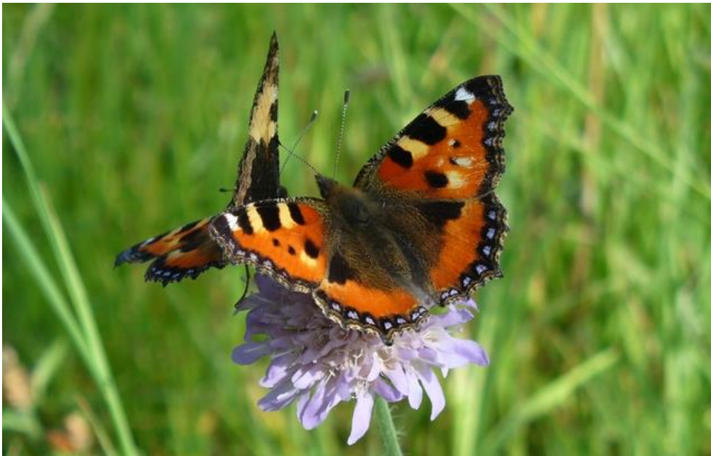
Abbildung 3: Auf den extensiv bewirtschafteten Flächen am Wingert herrscht eine große floristische und faunistische Artenvielfalt. Im Bild zwei Kleine Füchse ( Aglais urticae ) auf einer Acker-Witwenblume ( Knautia arvensis ).