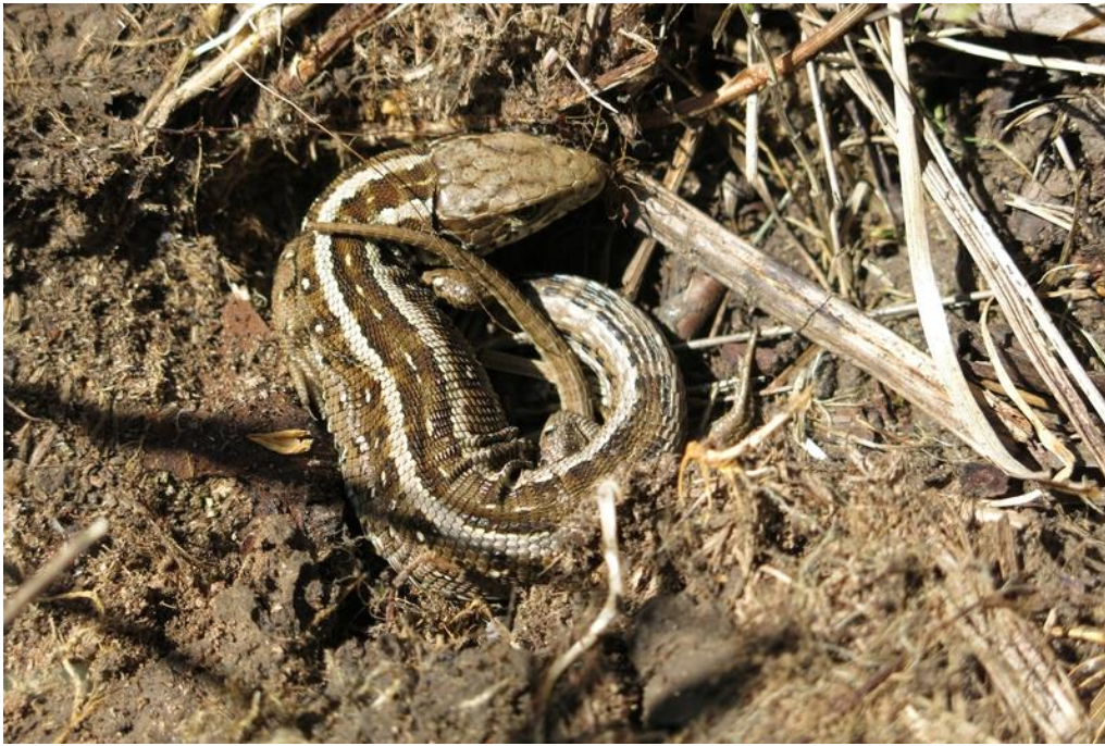
Abbildung 5: Die Zauneidechse ( Lacerta agilis ) ist eine nach BNatSchG streng geschützte Art, die im Anhang IV der FFH-Richtlinie gelistet ist. Die Art profitiert von einer extensiven Beweidung, hat aber auf intensiv gemähten oder gemulchten Flächen keine Überlebenschance.