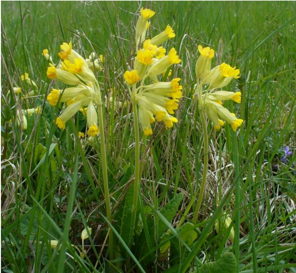
Abbildung 4: Echte Primel ( Primula veris ) auf dem Wingert bei Dorheim.