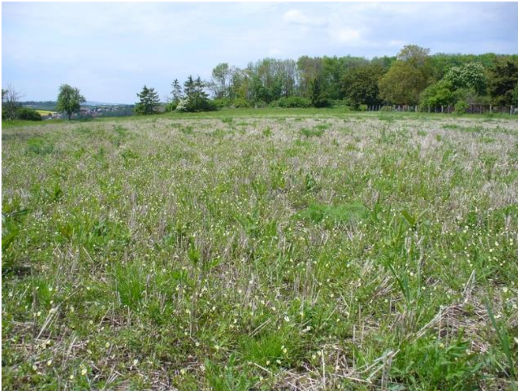
Abbildung 2: Eine inzwischen für Kompensationsmaßnahmen in Anspruch genommene Fläche auf dem Wingert. Im Vordergrund sind blühende Acker-Stiefmütterchen zu erkennen.