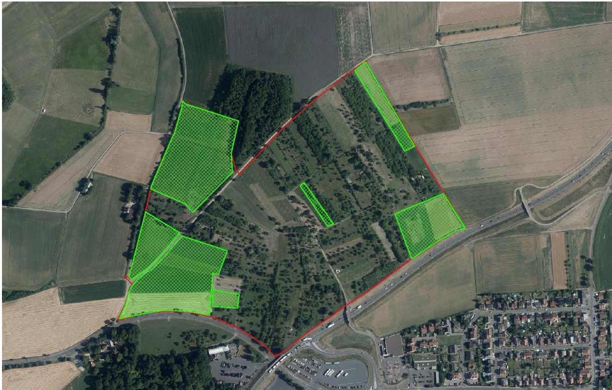
Abbildung 11: Für die Umwandlung in Streuobst empfohlene Ackerflächen