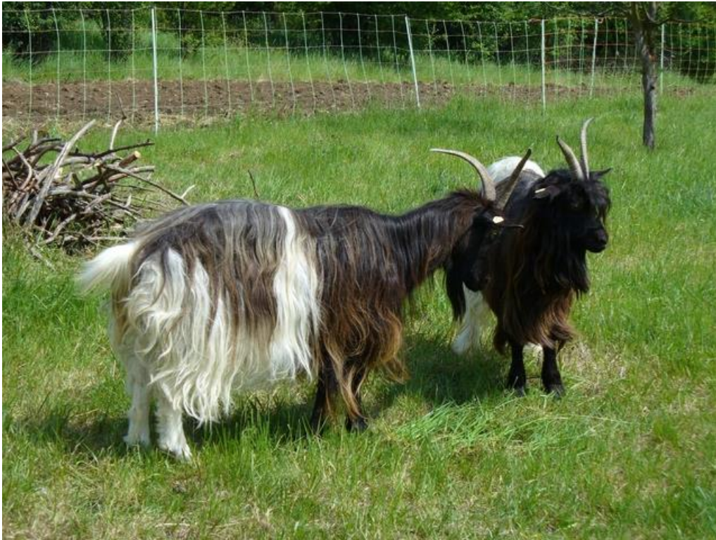
Abbildung 8: Walliser Schwarzhalzziegen eignen sich für gröbere Arbeiten wie den Verbiss von Gehölzen.