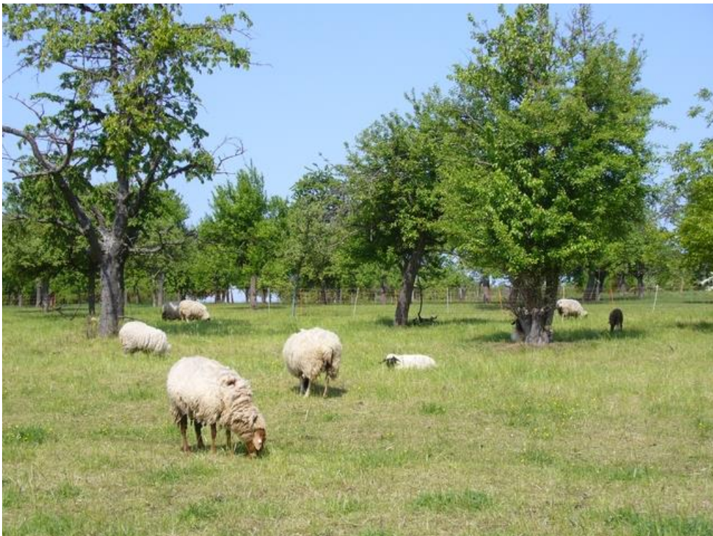
Abbildung 7: Rhönschafe und Coburger Füchse bei der Landschaftspflege.